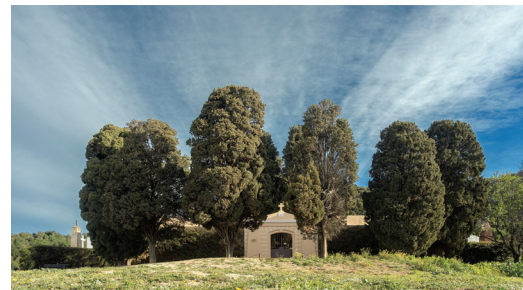
La Arbreda de Xiprers del Cementiri 99x52 cm