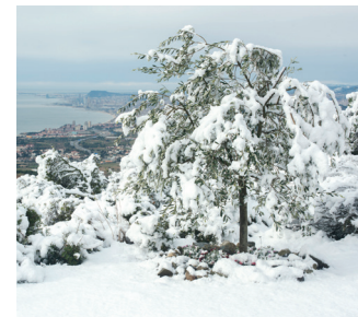
La Olivera de la Fiona 59x52 cm