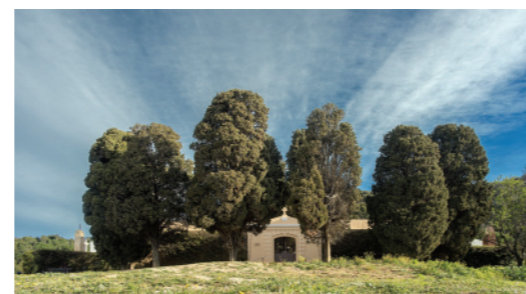
La Arbreda de Xiprers del Cementiri 99x52 cm