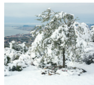
La Olivera de la Fiona 59x52 cm